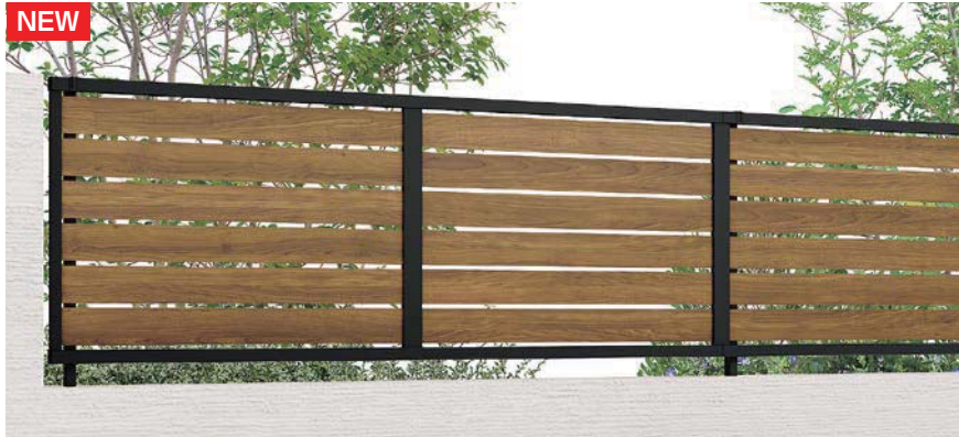
ブラック+チェリーウッド フリーボールタイプ T-8

本体ピッチ2,000mm(フリーボールタイプ専用) ※間仕切りタイプのフェンス本体は特注対応品です。 間仕切り柱は受注生産品になります。(詳細はP.937参照)